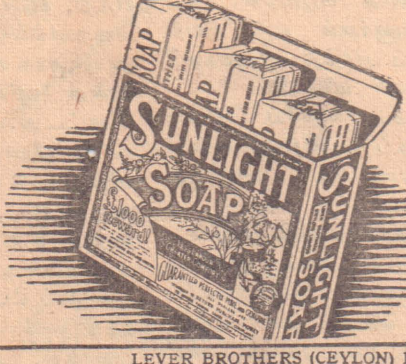
LEVER BROTHERS (CEYLON) LIMITED