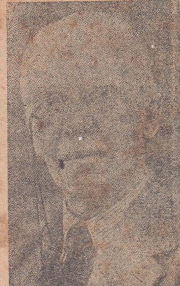
சென்றவரம் யாழ்ப்பாணத்துக்கு விஜயம் செய்த பிரதம தேசாதிபதி சோல்பெரி பிரபு

செருப்புக்கால், மிதியடிக்கால், சப்பாத்துக்கால் எல்லாக்கால்களின் கீழுக்கிடந்து இந்தச் செந்தமிழ் - தெய்வந்தமிழ் - அக்கரங்கள் மிதியுண்டு உழக்குப் படுகின்றனவே! தமிழெழுத்தைக் காலால் மிதிக்கக் கூசும் பழைய மனிதர், படித்த, மனிதர், இன்னும் பலர் இந்த நகரத்திலிருக்கிறார்களே! இவர்கள் தெருவழியே சென்றது பேரிடாக விருக்கின்றதே! இந்தத் தமிழ் எழுத்துக்களுக்கு இப்படியான துரோகம் எந்தக் காலத்திலேனும் நடந்ததுண்டா? தமிழன் தன் தாய்மொழியெழுத்துக்களைக் காணல் மிக்கமேபோது அவனுடைய கால் கூசுமே! தாய்மொழியெழுத்துக்களைத் தாமும் மற்றையெல்லாருங் காலால் உழக்கச் செய்துவிட்டு, வட்டாரப்பிரதிகளையே நகரசபையுட் புகுந்து இந்தப்