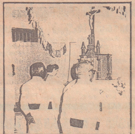
கண்காட்சி நிகழ்வின் ஓர் காட்சி அமைப்பாளர் கிதைதீன் முறையில் அமைந்த திருப்பலி காட்சியமைப்பை ஆயரும் குருக்களும் சேர்ந்து பார்வையிடுகின்றனர்.