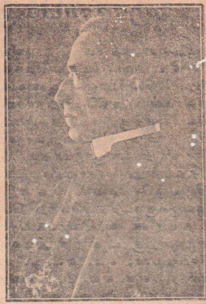
பரிசுத்த பாப்பரசரின் ஈஸ்றர் கோரிக்கை "சலவாயுக் குண்டைத் தடைப்படுத்துங்கள்"

இம்மாதம் 28-ந் திகதியன்று கொழும்பிலே ஆரம்பமாகி நடந்தேற விருக்கும் ஆசியப் பிரதமர்களின் மகாநாட்டில் கலந்துகொள்ளுமாறு பாகிஸ்தான் பிரதமர் முகம்மது அலி அவர்கள் தலைமையில் பாகிஸ்தான் தூதக் கோஷ்டி வருகிற 26-ந் திகதி ஆகாய விமானமூலம் கொழும்பு வந்தசேரும். இந்தியா, பர்மா, இந்தோனேஷிய நாடுகளின் பிரதமர்கள் விசேஷ விமானங்களமூலம் அடுத்த 27-ந் திகதி வந்துசேர்வாவிருக்கின்றார்கள். இந்த மகாநாட்டிலே பிரதமர் சேர் ஜோன் கொத்தலாவல அவர்களின் ஆலோசகர்களாக நிதிமந்திரியார் சேர் ஒலிவர் குணதிலக அவர்களும், உணவு-கமத்தொழில் மந்திரியார் ஜே. ஆர். ஜயவர்த்தன அவர்களும் இருந்துவருவார்கள்.