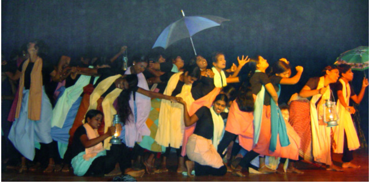
பூச்சிகள் நாடகம்: 1995 இல் ஒட்டுமொத்த யாழ்ப்பாணமும் இடம்பெயர்ந்ததை எடுத்துக்காட்டும் காட்சி