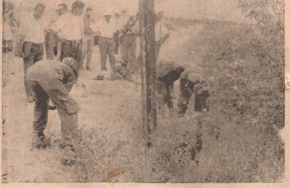
செம்மணிப் புதைகுழியைத் தோண்டும் பணியை சர்வதேச-உள்ளூர் பாவையாளர்கள் அவதானிக்கின்றனர்,