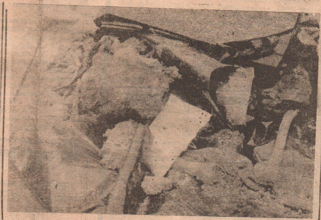
செம்மணிப்பகுதியில் தோண்டப்பட்ட மனிதப் புதைகுழியில் இருந்து மீட்கப்பட்ட எலும்புகளின் ஒரு தொகுதியைப் படத்தில் காணலாம்.