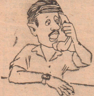
இது வழமையான சரணாகதி தான்...!