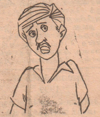
அப்ப கார்டில் தோல்விக்கு இது அறிகுறியோ.....!