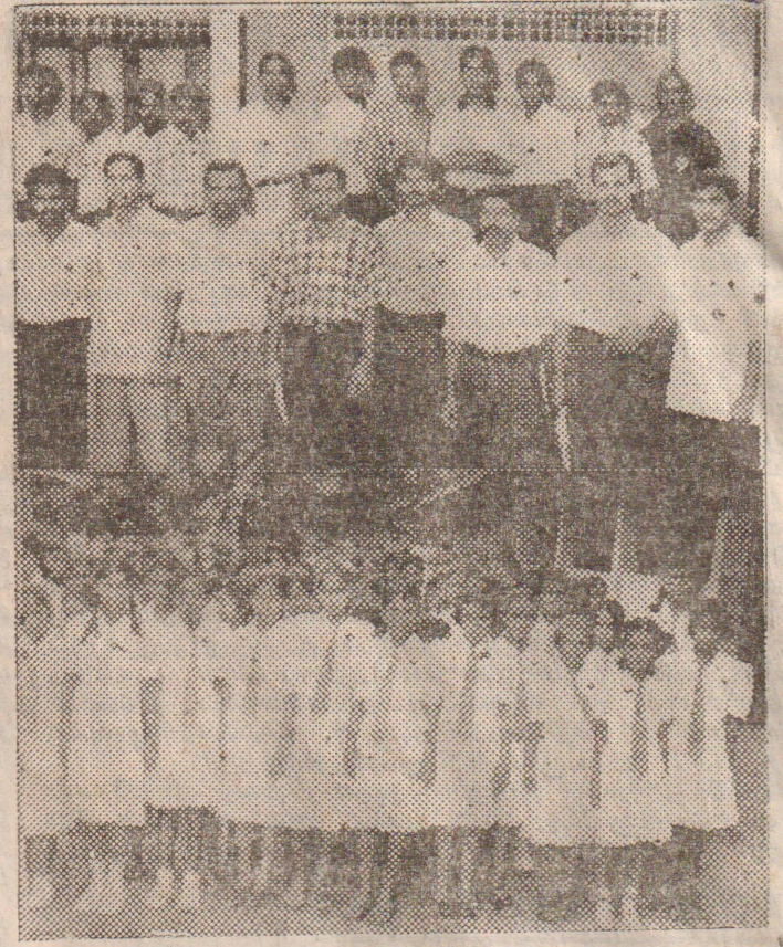
மேதே தேவாலயம் மீது நடத்தப்பட்ட தாக்குதலைக் கண்டித்து நேற்று இடம்பெற்ற போராட்டத்தில் பங்குபற்றிய யாழ்ப்பாணம் பஸ்கலைக்கழக மாணவர்களில் ஒரு பகுதியினரை மேற்படத்திலும், யாழ்ப்பாணம் இந்து மகளிர் கல்லூரி மாணவிகளைக் கீழ் உள்ள படத்திலும் கறுப்புப் பட்டிகளுடன் காணலாம்.

அதேநேரம் - முருகிக் பகுதியில் உள்ள குடியிருப்புகள் மீது நேற்று முன்தினம் இரவு மேற்கொள்ளப்பட்ட வெடித் தாக்குதல்களை அடுத்து அந்தக் கிராமங்களில் இருந்து மக்கள் இடம்பெயர்ந்ததாகத் தெரிவிக்கப்பட்டது. (2-3)