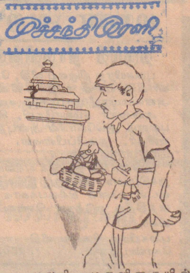
அலரி மாளிகையில் தொடங்கி இப்பணத்தையில் போய் நிக் குது பாருங்கோ...!