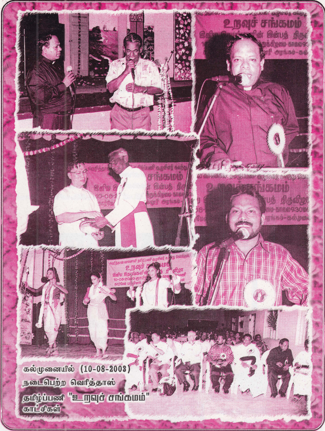
கல்முனையில் (10-08-2003) நடைபெற்ற வெரித்தால் தமிழ்ப்பணி "உருவுச் சங்கமம்" காட்சிகள்

St. Ignatius Type Setting - 28, Sinnalebbe Street, Batticaloa. Printing & Cover Designing - St. Joseph's Catholic Press, Batticaloa.