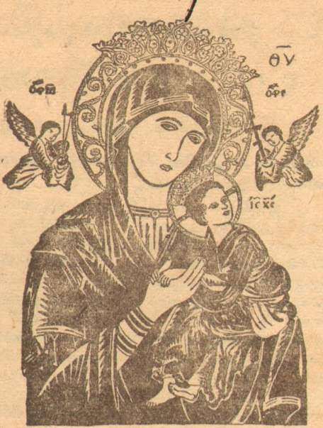
அர்ச். அடைக்கலமாதா கோவில் ஞானவொடுக்கம்

கம்பனியில் அன்றுநிகழ்ந்த தேர்தல் பிரசார கூட்டம்ஒன்றில் ஐக்கியதேசியக்கட்சித்தலைவர் திரு. டட்லி சேனாநாயகாபேசியபோது, உதவிப்பணம் பெறும் பாடசாலைகளை அரசாங்கம் எடுத்துக்கொள்வதானது இந்நாட்டில் சமயகல்விக்குக் குழிதோண்டிவதாகும்; அதனால் உதவிப்பணம்பெறும் பாடசாலைகளின்வளர்ச்சியை ஐக்கிய தேசியக்கட்சி ஒருபோதும்பாதிக்காது; சமயகல்விதான் மக்கள் ஒழுங்கும், கட்டுப்பாடுமான வாழ்க்கைநடத்தக் காரணமெனக் கூறலாயினர்.