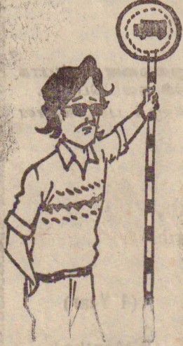
அப்ப நாடகம் கச்சிதமாய் அரங்கேறியிருக்கிறது என்று சொல்லுவீர்களே.....!

புதனன்று நிகழ்ந்த மோதலில் படையினரின் டாங்கி சேதம்