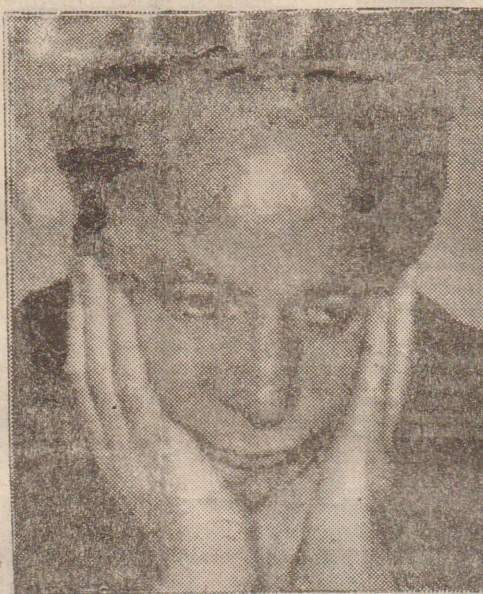
இஸ்லாமாபாத், நவ. 23

இப்படி அவர் மேலும் தெரிவித்தார். கடந்த மாதம் ஆட்சி கவிழ்க்கப்பட்டது முதல் காவலில் வைக்கப்பட்டிருந்த நவாஸ் ஷெரீப் கடந்த வெள்ளியன்று கராச்சி நீதிமன்றில் ஆஜர் செய்யப்பட்டார். நீதிமன்றில் வைத்தே அவர் இந்தப் பேட்டியை வழங்கி இருந்தார். [ஐ-6-8]