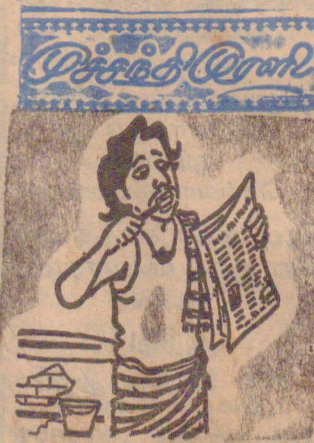
அப்ப பிரசாரத்தைக் கைவிட்டு போராட்டத்தில் இறங்கப்போறார் போலீஸார்...!

கொழும்பு, ஜூலை 20 மாகாண சபைகளுக்கான தேர்தல்களை நடத்தும் திட்டத்தை அரசு முன்னெடுக்குமானால் யுத்தம் தொடர்பான பொறுப்புக்களில் இருந்து நான் விலகிக் கொள்வேன். மேற்கண்டவாறு பிரதிப் பாதுகாப்பு அமைச்சர் ஜெனரல் அனுருத்த ரத்வத்த தெரிவித்தார். தேர்தல் பணிக்காக யுத்த முனையில் இருந்து படைகளை வாபஸ் பெற்றால் அது விடுதலைப்புகள் தங்களைப் பலப்படுத்த அவகா சத்தை வழங்கிவிடும் என்றும் அவர் கூறினார். மாகாணசபைத் தேர்தல்களை நடத்தும் திட்டத்தை அரசு முன்னெடுத்தால் பாதுகாப்பு ஏற்பாடுகளை மேற்கொள்ள போர் முனையில் இருந்து படைகளை வாபஸ் பெறவேண்டியிருக்கும். விடுதலைப் புலிகள் இதனையே விரும்புகின்றனர். தேர்தல் நடத்தப்படுவதால் இராணுவ நடவடிக்கையில் ஏற்படும் தளர்வுகள் (10 ஆம் பக்கம் பார்க்க)