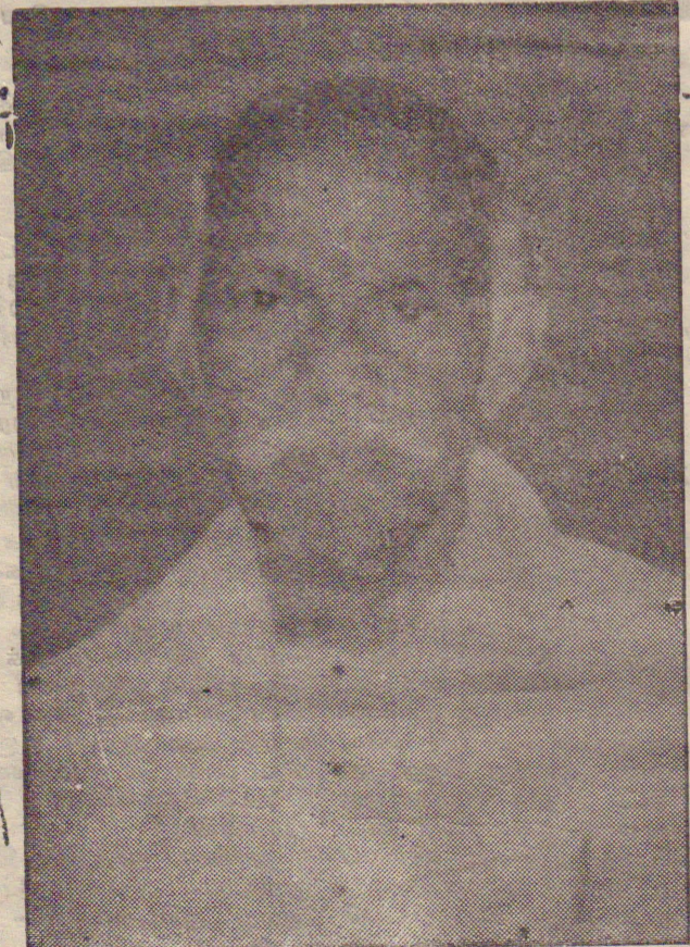
பலாலி தெற்கு - வயாவிளாள் ஒய்வுபெற்ற கிராமசேவையாளர்