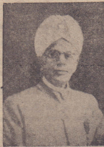
திருச்சேந்திரத்தில் திருவாசகப் பெருவிழா

இலங்கையின் இணையற்ற தலைவர் என்றால் இவ்வுத்தமரே