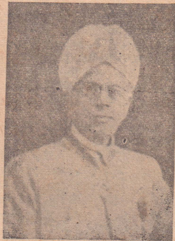
பொன்னுள் பொதுப்பணி மன்னன் வள்ளல். இராமநாதன்

சந்தர்ப்பத்தைப் பட்ட வேர். பொன், பாவித்த எமது குறை இராமநாதன் அவர்களால் களைத்தீர்க்க நேடியாகத் கட்டப்பட்ட பரமேஸ்வரக் கல்லூரியில் வளாகம் தொடர்பு கொள்ளவும் முயலவேண்டும். சைவ ஆலயங்களில் பிரச்சினை கிளப்பும் வண்ணம் எது வித ஆர்ப்பாட்டமும் செய்தால் அஃது அச்சம யத்தின் புனிதத்திற்கு இழுக்காக அமையு மன்றோ? நாட்டிற்கும், தமிழுக்கும் சைவத்துக்கும் தொண்டு செய்து, அகில இலங்கைத் தலைவராக அனைவராலும் ஏற்கப்