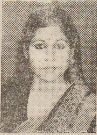
எமது பாசமிகு தங்கை