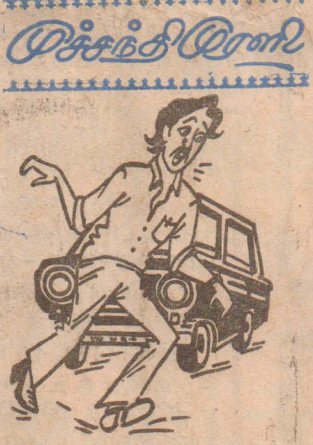
ஆவதும் பெண்ணாலே அழிவதும் பெண்ணாலே என்கும் மாவா சொல்லி இருக்கினம்.....!

கொழும்பு, ஜூன் 28 - நேற்று முன்தினம் நடைபெற்ற விசேட அமைச்சரவைக் கூட்டத்தில் மாகாணசபைத் தேர்தலின்போது ஏற்படக் கூடிய பாதுகாப்புப் பிரச்சினை குறித்து விரிவாக ஆராயப்பட்டதாகத் தெரிவிக்கப்படுகிறது. யுத்தத்தையும் நடத்திக் கொண்டு மாகாண சபைத் தேர்தல்களையும் நடத்துவது சிரமமாக இருக்கும் என்பதாலேயே மாகாண சபைத் தேர்தல்களை ஒத்தி வைக்க ஐ. தே. க. வின் உதவியை அரசு நாடி இருந்தது. வடக்கு - கிழக்கு யுத்தம் நடைபெறும் சந்தர்ப்பத் (10 ஆம் பக்கம் பார்க்க)