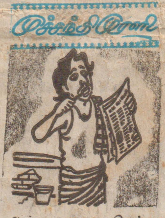
அப்ப கைது செய்வது தொடர்பு போகுது என்று சொல்லுங்கோ.....

கொழும்பு, ஜூலை 12 தமிழ் இளைஞர்கள் - யுவதிகள் கைது செய்யப்படும் போதும் தடுத்தவைக்கப்படும் போதும் துன்புறுத்தப்படுகின்றார்கள் என்ற குற்றச்சாட்டுக்களை விசாரணை செய்வதற்காக அமைச்சர்களையும், நாடாளுமன்ற உறுப்பினர்களையும் உள்ளடக்கிய குழு ஒன்றை ஜனாதிபதி சந்திரிகா குமாரதுங்க நியமித்துள்ளார். இலங்கையில் தமிழ் இளைஞர்களும் யுவதிகளும் விசாரணைகளின் போது சடுமை யாகத் துன்புறுத்தப்படுகின்றார்கள் என்ற முறைப்பாடுகளை அடுத்தே இந்தக் குழு நியமிக்கப்பட்டுள்ளது. பெளத்த சாசன, கலாசார, மதவிவகார அமைச்சர் (10 ஆம் பக்கம் பார்க்க)