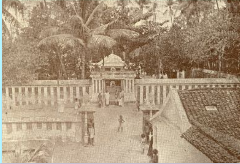
மயிலைத் திருவள்ளுவர் கோயில் வெளிப்புறத் தோற்றம்