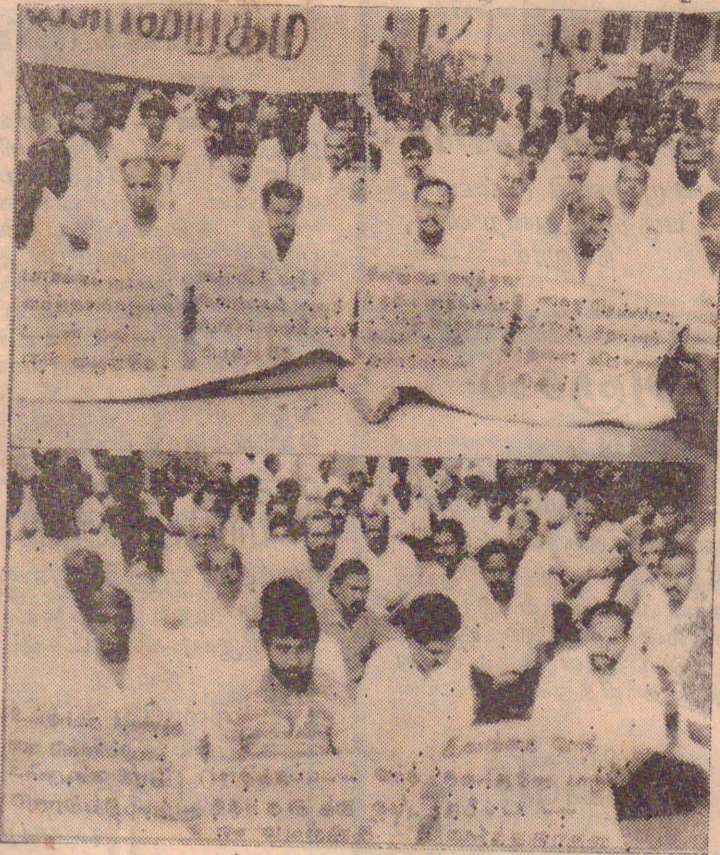
செயலக வளவில் நேற்று நடைபெற்ற அடையாள உண்ணாவிரதப் போராட்டத்தில் கலந்து கொண்ட வர்த்தகர்களில் ஒரு பகுதியினரைப் படங்களில் காணலாம். அரசியல் கட்சிகளைச் சேர்ந்த பிரதிநிதிகளும் வர்த்தகர்களுடன் காணப்படுகின்றனர்.

அவற்றை வெளியிடுவது தடை செய்யப்படுவதாகவும் பாதுகாப்பு அமைச்சின் நடவடிக்கைத் தலைமையகம் தெரிவித்தது. யுத்தச் செய்திகளை வெளியிடுவதற்குத் தற்போது தணிக்கை அமலில் இருந்து வருவது தெரிந்ததே. [ஐ-9]