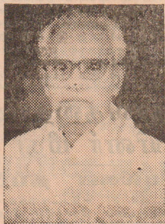
இறைவனடி சேர்ந்த இணுவில்.