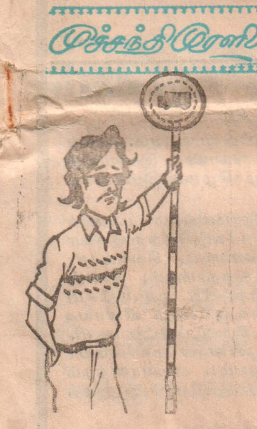
அப்ப தேர்தல் இப்போதைக்கு இல்லை போல.....!