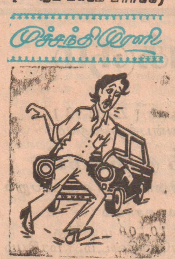
அப்ப வெளிநாடு போனாலும் திருந்த மாட்டினம் போல ...!

வவுனியா, செப். 3 முல்லைத்தீவு செயலகம் முன்பாக நேற்றுக் காலை சுமார் 200 பேர் நீராகாரம் இன்றி உண்ணாவிரதம் மேற்கொண்டனர். நிவாரண வெட்டை நீக்குமாறு கோரியே இந்த உண்ணாவிரதம் இடம்பெற்றது. கடந்த 23 நாட்களாக முல்லைத்தீவு அரசு செயலகம் முன்பாக மறியல் செய்து வந்த மக்களே நேற்று உண்ணாவிரதத்தை அனுஷ்டித்தனர். இந்த உண்ணாவிரதத்தில் பங்கு கொண்ட சிலர் மயக்க மடைந்த நிலையில் ஆஸ்பத்திரியில் சேர்க்கப்பட்டனர். நிவாரண வெட்டை நீக்கக் கோரி முல்லைத்தீவு செயலகம், புதுக்குடியிருப்பு உதவி அரசு அதிபர் அலுவலகம் (12 ஆம் பக்கம் பார்க்க)