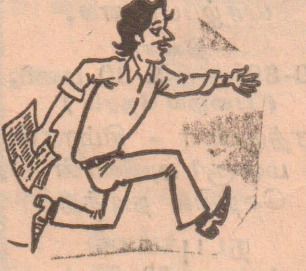
அப்ப எட்டாத பழம் புனிக்கும் என்று சொல்லுங்கோ! Digitized by Noolaham Foundation.