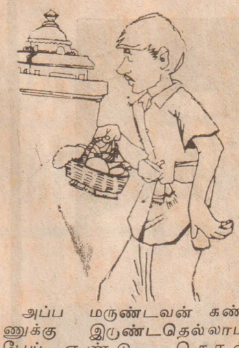
அப்ப மருண்டவன் கண்ணுக்கு இருண்டதெல்லாம் பேய் என்று சொல்லுங்கோ.....!