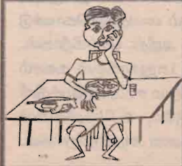
குறும்புயா - 1

சிறப்பான முறையில் பவுல் ஆண்டானது கிரீஸ்தவ சபைகளுக்கிடையேயான ஒன்றிப்பு ஆண்டாக அமைய வேண்டும். எல்லாக் கிரீஸ்தவர்கள் மத்தியிலும் ஒற்றுமையும் ஈடுபாடும் ஏற்பட பவுல் உழைத்தமையை திருத்தந்தை நினைவுட்டினார்.