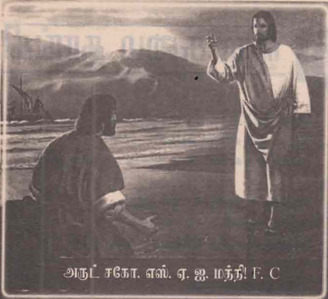
அருட் சகோ. எஸ். ஏ. ஐ. மந்தி! F. C

ஏன் நன்றி செலுத்துகின்றேன்? இறைவனின் அருள் இரக்கத்தினால் தான் என்னால் இவ்வாறு வாழ முடிந்தது. வாரத்திற்கு இருமுறை நோன்பிருக்கிறேன். எனக்கு ஏராளமான வருமானமுண்டு. பணக்காரர்கள் பொதுவாகப் பணத்தைச் செலவு செய்யமாட்டார்களே! மேலும் மேலும் தம் பணத்தை அதிகரித்து, அவ்வதி கரிப்பைக் கண்டு மனம் பூரிப்படைந்து பணத்திலேயே காதல் கொண்டு, வெறி கொண்டு வாழ்கிறார்கள் என்பது உமக்குத் தெரியுமே? அப்படியிருக்க நானோ எனது ஏராளமான வழிகளில் சுருக்கமாகக் கூறுவதாயின் எனது வருவாயில் எல்லாம் 1/10 சட்டப்படி கொடுத்துவிடுகிறேனே.