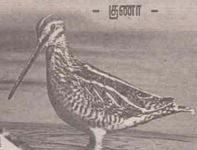
- குணா -

கிறீஸ்து பிறப்பதற்கு முன்பு யூதர்களின் அரசனாக இருந்த ஹெரால்ட் கட்டிய கோட்டை அது. ஓர் அறையில் மறைவாகப் புதைக்கப் பட்டிருந்த 14 சுருள்கள் கிடந்தன. அவை எல்லாமே விவலியப் பிரதிகள். கி.பி. 73க்கு முன் எழுதப்பட்டவை. மசதா இன்று இஸ்ரேல் நாட்டு மக்களால் புனிதமான இடமாகப் போற்றப்படுகிறது.