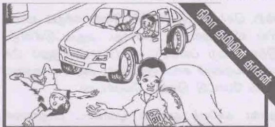
நிலா துறியின் காசன்

“தொண்டன்” சஞ்சிகையில் வரும் போட்டிகளில் பங்குபற்றுவோரில் பரிசு பெறும் சிறுவர், சிறுமியர் எமது அலுவலகத்திற்கு அண்மையில் வசிப்பவராயின் நேரடியாக வந்தும் பரிசுத் தொகையைப் பெற்றுக்கொள்ள முடியும் என்பதை அறியத்தருகின்றோம்.