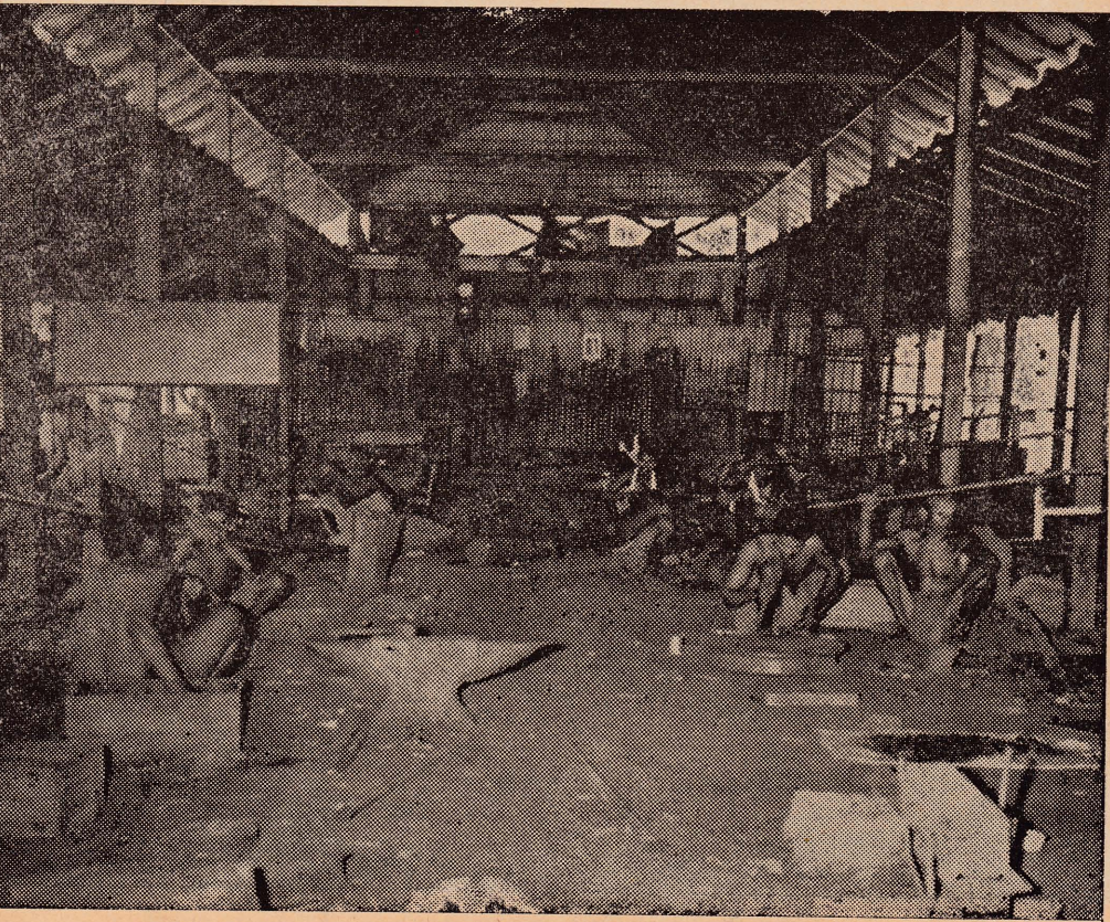
செந்தியின் முன்னே தொழிற் செம்மை திகழ்கிறது.

மரமறுக்கும் பிரமாண்டமான மின் இயந்திரம் வரவேற்கின்றது. அப்பொழுது