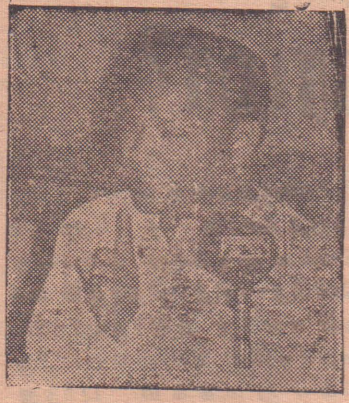
சாவகச்சேரி, ஏப். 18. ஈழத்தமிழினத்தின் எழுச்சி அணியாம் தமிழரசுக் கட்சியின் உணர்ச்சி வரலாற்றில் இன்னுமெரு எழுச்சிப்பொன்னேடு சாவகச்சேரி தமிழரசுக் கட்சி வாலிப முன்னணி மாநாடு! இத்திங்கள் பத்தொன்பதாம் இருபதாம் நாட்களில் சாவகச்சேரிச் சந்தை மைதானத்தின் கொடிகாமம் ஐயா அரங்கிலே நடக்கவிருக்கும் எழுச்சி விழாவுக்காக வடபகுதி விழாக்கோலம் பூணத் தொடங்கி விட்டது. என்னும் தமிழரிடே இதுவே பேச்சு-இதைக் கேட்டு விழுந்தது எதிரிகளின் மூச்சு!

உங்கள் வீட்டில் திருடுவ தற்கு இரவில் திருடர் கூட்டம் ஒன்று நுழைந்து விட்டதென்று வைத்துக்கொள்ளுங்கள்! அப் பொழுது நீங்கள் திருடர்களிடம் உடனடியாக சரணாகதியடைந்து பெட்டிச் சாவிகளையும் ஒப்படைத்து விட்டால் அவர்கள் உங்களைத் தொல்லைப் படுத்த மாட்டார்கள். உங்களை கொடுமைப்படுத்தாது உங்களது சொத்துக்களையும் அபகரித்துக் கொண்டு ஓடிவிடுவார்கள். ஆனால் நீங்கள் அவர்களை எதிர்த்துப் போராடினால் தாக்குதலுக்குள்ளாக வேண்டியே நேரிடும்! சொத்தைக் காப்பாற்ற வேண்டுமென்றால் கஷ்டப்பட்டே தீர வேண்டும்!