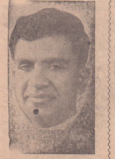
செய்த ஒருவரின் மகனுக்கு அடிவிழுக்கின்றது எனக்கேள் விப்பட்டுத்தான் நான் ஒடோடியும் அங்கு போய்ச் (4ம் பக்கம் பார்க்க)