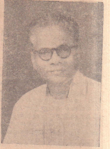
போக்குவரத்துப் பிரச்சினை குடிநீர் பிரச்சினை முதலிய (4-ம் பக்கம் பார்க்க)

"எங்கள் பகைவர்கள் எங்கே மறைந்தார் இங்குள்ள தமிழர்கள் ஒன்றாகக் கட்டை" என்ற பாரதிதாசன் கூற்றின்படி இங்கே திரண்டிருக்கும் மக்கள் வெள்ளத்தைக் காணும் போது நான் மட்டிலா மகிழ்ச்சியடைகிறேன். எனது வெற்றி பல ஆயிரக்கணக்கால் இங்கு திரண்டிருக்கும் மக்கள் வெள்ளம் எனக்கு எடுத்தியம்புகிறது. நான் எப்படி கிளிநொச்சியில் இருபத்தி நாலு மணித்தியாலமும் சேவை செய்து மக்களின் துயர் துடைக்கப் பாடுபட்டேனோ அதுபோல் ஊர்காவற்றுறைத் தொகுதியில் பிந்தங்கிய நிலையிலுள்ள உங்கள் தொகுதியின் முக்கிய பிரச்சினையான