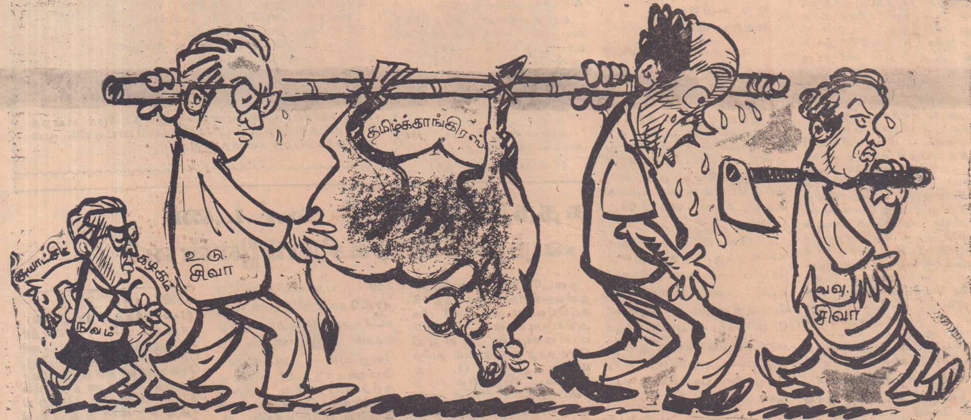
சுதந்திரன் 27-5-70ல் மேற்கண்ட 'கார்ட்டூன்' வெளியிட்டிருந்தோம். சுதந்திரன் தீர்க்கதரிசனத்துடன் குறிப்பிட்டிருந்தபடி தமிழ் காங்கிரஸ் என்னும் செத்தமாட்டை 'கார்ட்டூனில்' குறிப்பிடப்பட்டுள்ள மூவரும் மே 27ல் குழி தோண்டிப் புதைத்துவிட்டனர். ஆனால் புதைத்த மாட்டை வெளியே எடுத்து உயிர்கொடுக்கும் வேலையில் புதிதாக மூன்று முட்டாள்கள் இறங்கியிருக்கின்றனர். செத்த மாடு செத்த மாடுதான். அதற்கு உயிர் கொடுக்க இனி யாராலும் முடியாது!