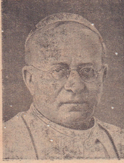
மேய்விவாகத்தைப் பற்றிப் 11-ம் பத்திநாத பாப்பரசரின் நிருபம்

● உலகலேயே மிகப்பிரமாண்டமான வானொலித் தூரதிருஷ்டியந்திரம் ஒன்றைத் தற்போது சோவியத் ரஷியா அமைத்து வருவதாக லண்டனிலிருந்து சென்ற 2-ந் திகதி செய்தி கிடைத்திருக்கிறது. இதிலுள்ள தூரதிருஷ்டிக் குழாயின் நீளம் 750 அடியென்றும், பிரித்தானியிலுள்ளதிலும் பார்க்க இது மிகப்பெரிதாய் இருக்கும்மென்றும் மஸ்கோவானொலி தெரிவித்திருக்கிறது.