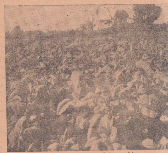
யாழ்ப்பாணக் கமக்காரரின் உயிர்நாடி.

பயனை அளிக்கின்றனவோ அப்படித்தான் புகையிலையும் யாழ்ப்பாண மக்கட்கு. அரசினர் இவ் வியாபார விஷயமாகக் கூடிய அக்கறைகொண்டு அதை நிலைபெறச் செய்தல் வேண்டும். அப்போதுதான் யாழ்ப்பாணக் கமக்காரனுக்கு நிம்மதியுண்டு.