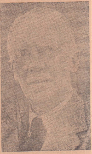
மகாராணி எலிசபெத் இலங்கைக்கு வர முடியாத காரணத்தால் கொழும்புத் திட்டப் பொருட் காட்சியைத் திறந்து வைக்கும் பாக்கியத்தைப் பிரதம தேசாதிபதி சோல் பெர்ப் பிரபு பெற்றுள்ளார்கள்.

இலங்கையின் பழைய சரித்திரத்தை உணர்த்தி வைக்கும் காட்சிப் பொருள்கள் உட்பட இந்நாட்டின் கலை, கைத்தொழில் சம்பந்தமான பொருள்களும் காட்சிக்கு வைக்கப்பட்டுள்ளன. சுருக்கக் கூறின் இலங்கையின் தேசிய மண்டபம் ஒரு கலைக் கோயிலாகவே காட்சியளிக்கின்றது. அரசாங்கப்பகுதிகள் இலங்கை அரசாங்கத்தின் பல்வேறு பகுதிகளும் இப்பொருட்காட்சியில் ஈடுபட்டு உழைத்துள்ளன. கைப்பணி, கலை, கலாசாரம் ஆகியவற்றின் துறைகளில் நாடு அடைந்துள்ள அபிவிருத்தியை எடுத்துக்காட்டும் காட்சிப்பகுதிகள் மிக ஆராய்வுடன் ஒழுங்கு