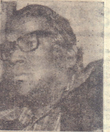
இப்பத்திரிகை, இலங்கைத் தமிழர் பிரச்சினை குறித்து செய்தி வெளியிட்டிருந்தது.

'லேமொண்டே' என்ற இப்பிரெஞ்சு நாளேடு, 'லண்டன் ரைம்ஸ்', 'கார்டியன்', 'சென்னை இந்து' போன்ற பத்திரிகைகளையும் விட சர்வதேச கவனத்தை ஈர்த்து வருவதாகும், ஐந்து இலட்சத்துக்கு மேற்பட்ட பிரதிகள் விற்பனையாகும்.