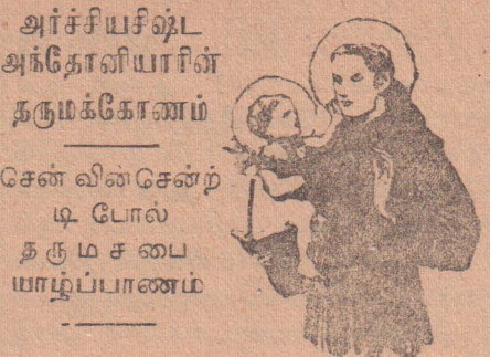
நன்றியறிந்த ஸ்தோத்திரங்களும் மன்றாட்டங்களும்

காங்கேசன்துறைச் சீமெந்துத் தொழிற்சாலையிலுள்ள மின்சாரபவர்ஸ் நேஷன் சென்ற செவ்வாய்க்கிழமை இரவு 7 மணிவரையில் திடீரென இயங்காமல் நின்றுவிட்டது. அதனால் அதிலிருந்து கடுமையான வெளியேறிய யாழ்ப்பாணப்பட்டணமுழுவதும் அரைமணி நேரம் வரையில் மின்சாரவிளக்குகள் அணைத்துவிடவே, எங்கும் இருளடர்ந்து காணப்பட்டது. அவ்விளக்குகள் அணைந்துபோன விடுகளிலெல்லாம் ஒரே அமளியாயிருந்தது. அரைமணி நேரத்தின்பின் பார்வையடைந்த குருடணப்போன்று பட்டணமும் பிரகாசத்தைக்கண்டது.