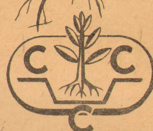
The Hallmark of Reliability