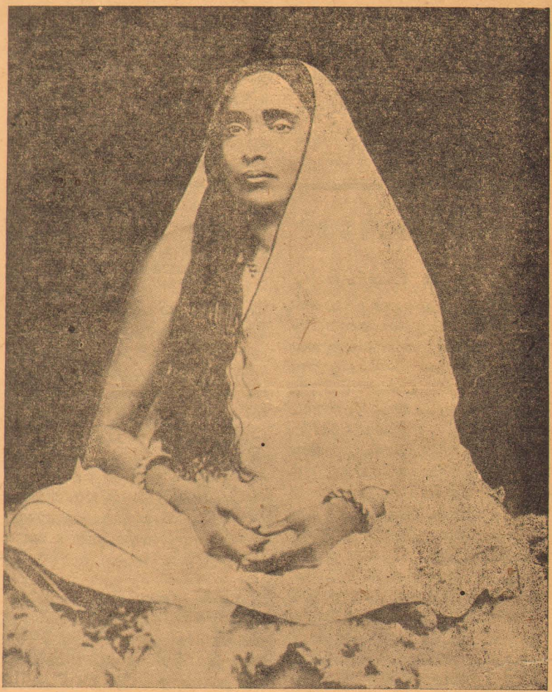
தாய அன்னை ஸ்ரீ சாரதாமணி தேவியார்

கூடிய ஞானத்திற்கும் இனிமைக்கும் அவர் இருப்பிடமாகிறார். ஆயினும் அவரது மரியாதையிலுள்ள காம்பீரியமும் அவரது பெருமையற்ற காவற்ற உள்ளமும் அவரது ஞானமிகமைக்குக் கிட்டத்தட்ட இணையாக ஆச்சரியம் வாய்ந்ததாகிறது. அவரிடம் கேட்கும் கேள்வி எவ்வளவு புகிதாயினும் சிக்கலாயிருப்பினும், உதாரமான மறைத்தான ஒரு தீர்ப்பை அளிப்பதற்கு அவர் சிறிதும் தயக்கியதை பறியேன். அவரது வாழ்வு ஒரு நீண்ட அமைதியார்த்த பிரார்த்தனை மயமாகிறது. அவரது முழு அனுபவமும், ஞானஆட்சி நிகழும் நாகரீகத்தைச் சார்ந்ததாகின்றது. ஆயினும் அவர் எந்தச் சமயத்திலும் உசிதமான முறையிலே காரியம் இயற்றும் திறமைவாய்ந்திருந்தார். அவரைச் சூழ்ந்திருப்பவருள் பாரேனும் தமது தவறான செயலிற் பிடிவாதம் உடையராயினும், அதனால் அவர் தொந்தரவு அடைவதில்லை. அப்போது அவரிடத்திற் காணப்படும் அடையாளம் ஒரு புதுமையான அமைதியும் ஆழ்ந்த சிந்தனையும் தான். அவரால் அறியமுடியாத சமூகக் கிளர்ச்சிகளினின்றும் உதிக்கும் யாதேனும் ஒரு மனக் சூழல்பத்தையோ மனத்தாங்கையோ அவரிடம் ஒருவர் உரைக்கின்றனரா? பிழையாத ஞானக்காட்சியோடு அவர் விஷயத்தில் நேரே உட்புகுந்து, அச்சங்கடத்தைத் தீர்க்கும் மனநிலையில் கேட்பவரை வைத்துவிடுவார். கடுமையா