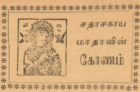
சதாசகாய மாதாவின கோணம்