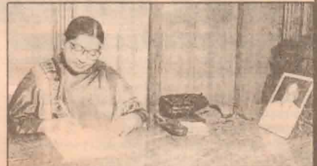
"நான் பதவிப் பிரமாணம் செய்து கொள்ளலாமா?" என்று மெல்லிய குரலிலேயே கேட்டார்.

அ.தி.மு.க வேட்டாளர் பட்டியலை ஆளுநரிடம் கையளித்த போது ஜெயலலிதா மிகவும் பரபரப்புடனேயே இருந்தார்.