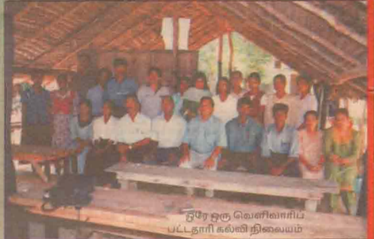
ஒரே ஒரு வெளிவாரிப் பட்டதாரி கல்வி நிலையம்