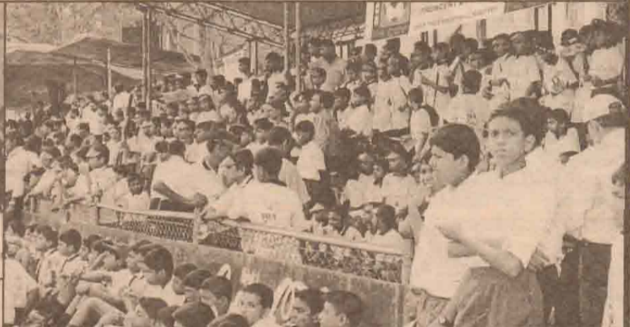
விழாவில் பார்வையாளர்களாகப் பங்குபற்றிய மாணவர்களில் ஒருபகுதியினர்.

ஃபிஃபா தலைவர் நிதியிலிருந்து 40 லட்சம் அமெரிக்க டொலர்களை நன் கொடையாக வழங்குவதாகவும் அவர் அறிவித்தார்.