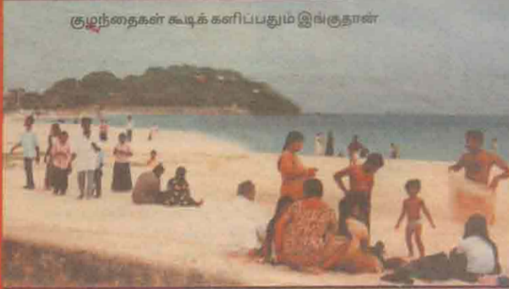
குழந்தைகள் கூடிக் களிப்பதும் இங்குதான்

பூமியாக அது மாறி வருவது தான் வேதனை தருகிறது. ஒரு சமூகத்தை அல்லது ஓர் இனத்தை அழிக்க வேண்டுமானால் அதன் கல்வி வளத்தை அழித்தாலே போதும். ஏனைய அழிவுகள் தாமதமே நிறைவேறிவிடும். இந்த வகையில், திருகோணமலையில் உயர் கல்வி பயிலும் மாணவர்களின் நிலை குறித்து கவலை எழுப்பப்படுகிறது. ஆரம்ப வகுப்பு முதல் டி.சி. (உயர்தரம்) வரை திருகோணமலையில் கல்வி வசதிகள் இருக்கின்றன.