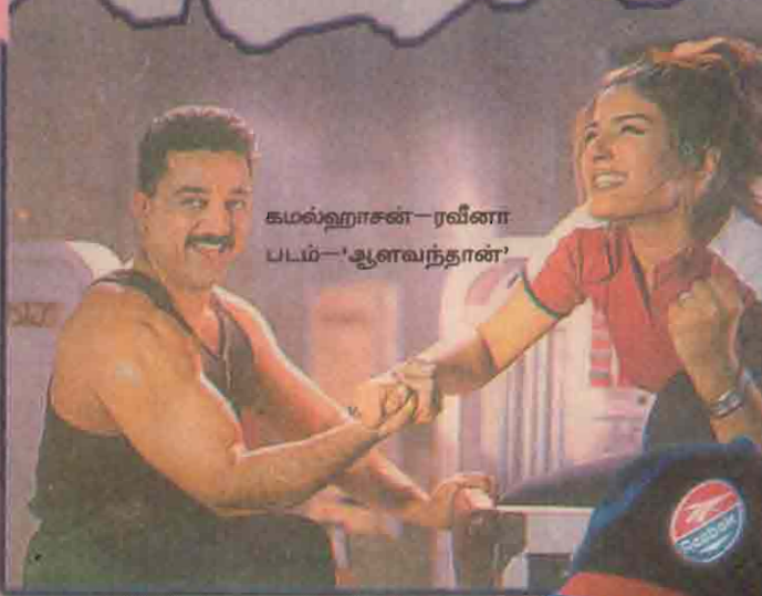
கமல்ஹாசன் - ரவீனா படம் - 'ஆளவந்தான்'