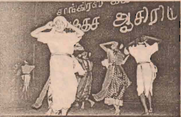
மாணவிகளின் கலை நிகழ்ச்சி

மத்திய மாகாண தமிழகக் கல்வி அமைச்சினால் ஏற்பாடு செய்யப்பட்டிருந்த இந்த விழாவுக்கு மத்திய மாகாண தமிழகக் கல்வி அமைச்சர் தலைமை வகித்தார். அங்கு பாடசாலை மாணவர்களின் கலை நிகழ்ச்சிகளும் இடம் பெற்றன.