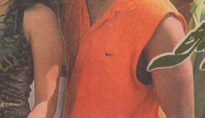
அபர்ணா - தீனா படம் - 'தோஸ்த்'

இளைய தளபதிக்கு கிராமத்து டைரக்டரின் புடங்களில் நடிப்பதற்கு ஆசையாம். ‘லக்’