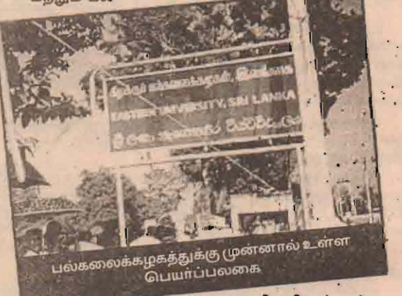
வழிகளிலும் அந்த இளம் விரிவுரையாளர் மாணவிகளுடன் முறைகேடாக நடந்துகொள்கிறார்.

பரிட்சை வினாக்களை முன்சூடியே மாணவி களுக்கு வழங்க முன்வருகிறார். அதற்குக் கைமாறாக அவர்களை டூல் உறவுக்கு அழைக்கிறார். மற்றும் பல