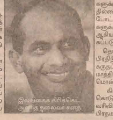
இலங்கைக் கிரிக்கெட் அணித் தலைவர் சந்த

கிரிக்கெட் வீரர்களுக்கான கொடுப்பனவுகளுக்கு வருமான வரிவிலக்கு இல்லை." இவ்வாறு பிரதமர் கூறியுள்ளார்.