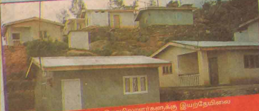
இதல் கஸ்ஸிள்ளை தோட்டத் தொழிலாளர்களுக்கு இயற்கையிலே நிறுவனம் அமைத்துக் கொடுத்த நவீன வீடுகள்.

"விசேஷம் தான் மீட்டர் க்ரோ, உடையமும் தற்றும் குறைகளை மட்டுமே கிண்டுகிறீர்கள். பட்டினம் செய்வதை திரும்பியும் பார்க்க மாட்டீர்கள்" என மருடியாக விசேஷத்திற்கு வந்துவிட்டார் செய்தியாளர்.