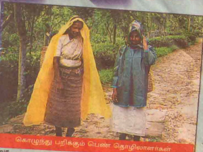
கொழுந்து பறிக்கும் பெண் தொழிலாளர்கள்