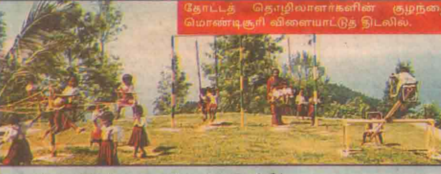
தோட்டத் தொழிலாளர்களின் குழந்தைகள் மொண்டுகூரி விளையாட்டுத் திடலில்.

"தோட்டத் தொழிலாளர்கள் என்றால் கொத்தடிமைகள், அவர்களின் உழைப்பு மட்டும் தான் நமக்குத் தேவை. அவர்களுக்கு எந்த வசதியும் தேவை இல்லை என கம்பெனிக்காரர்களும், அரசாங்கமும் நினைக்கும் போது அதற்கு மாறாக ஒரு நிறுவனம் தொழிலாளர்களுக்குப் பல்வேறு வசதிகளைச் செய்து கொடுத்துள்ளது. இதையும் நீங்கள் வெளிப்படுத்த வேண்டும்" என்று கேட்டுக் கொண்டார் செய்தியாளர்.