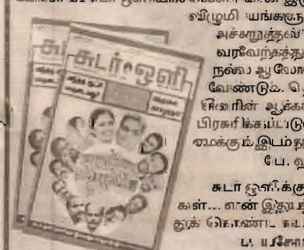
கூடர் ஒளி • நவம்பர் 04, 2001