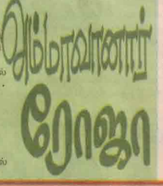
ரெனுகிய வட்டாரங்கள் தெரிவிக்கின்றன.

விட்டார். பூமிகா நடித்து வரும் படங்கள் முடிவடைந்ததும் திருமணம் நடக்கலாம் என்று ரெனுகிய வட்டாரங்கள் தெரிவிக்கின்றன. —ஆம்