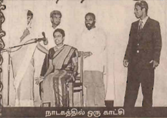
நடாகத்தில் ஒரு காட்சி