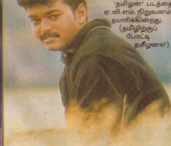
'தமிழன்' படத்தை ஏ.வி.எம். நிறுவனம் தயாரிக்கின்றது. (தமிழ்நாடு போட்டி தமிழனா?)

திரைத்துழைப்புத் திரையுலகத்திற்கு தமிழ் மீது பற்றுதல் ஏற்பட்டிருக்கின்றது. பிரசாந்த் - சிம்ரன் ஜோடியாக 'தமிழ்' உருவாக்கக் கொண்டிருக்கின்றது. இப்போது விலும் - பரியங்கா சோப்ரா ஜோடியாக நடிக்கும் படத்திற்கு 'தமிழன்' என்று பெயர் வைத்திருக்கிறார்கள்.