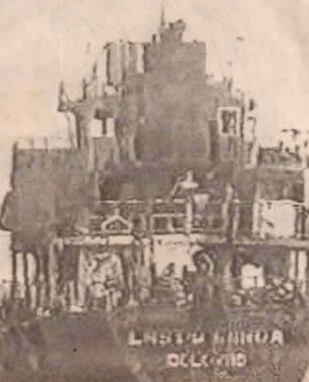
புலிகளின் தாக்குதலுக்குள்ளான துன்கிந்த தீப்பிடித்து எரிகிறது

பணியாளர்களைத் தவிர திருமலைக்கும் காங்கேசன்துறைக்கும் இடையே விடுமுறையில் சென்று திரும்பும் சில படையினர் மட்டுமே கப்பலில் இருந்தனர். இதனால் புலிகளின் படகுகள் மீது கப்பலில் இருந்தவாறு பெரும் எடுப்பில் எதிர்த் தாக்குதலை நடத்த வாய்ப்பின்றிப் போனது.