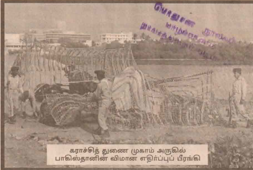
கராச்சித் துணை முகாம் அருகில் பாகிஸ்தானின் விமான எதிர்ப்புப் பிரங்கி

விமானங்கள், ஏவுகணைகள் என்பனவற்றை அனுப்ப நடவடிக்கை மேற்கொள்ளப்பட்டு வருகின்றது.