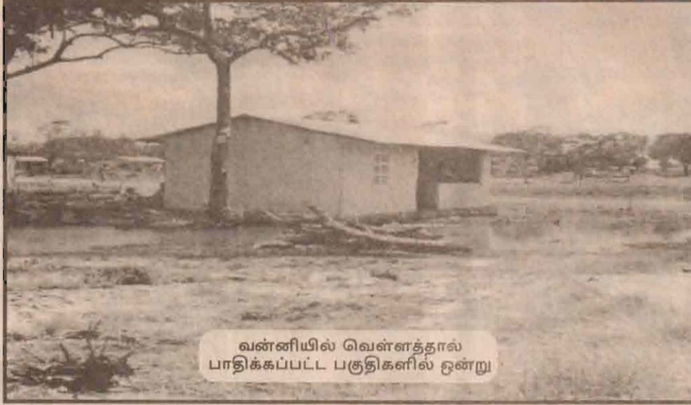
வன்னியில் வெள்ளத்தால் பாதிக்கப்பட்ட பகுதிகளில் ஒன்று

தொடர்கின்ற கரும் மழை காரணமாக வன்னிப் பிரதேசத்தில் குடிசைகளில் வாழும் மக்கள் பெரும் அவலங்களை எதிர்நோக்கி வருகின்றனர். நிறை குடியிருப்பைச் சேர்ந்த 40 குடிசைகளின் கூரைகள் சேதமடைந்துள்ளன. சுவர்கள் பல இடிந்து விட்டன. அப்பகுதி வாழ் மக்கள் அங்கு வசிக்க முடியாது. அங்கிருந்து இடம் பெயர்ந்து