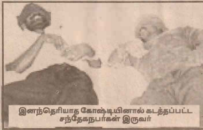
இனத்தெரியாத கோஷ்டியினால் கடத்தப்பட்ட சந்தேகநபர்கள் இருவர்

மடவனாச் சம்பவத்தில் ஏற்பட்டுள்ள முக்கிய திருப்பங்களில் ஒன்று, இனம் தெரியாத கோஷ்டி ஒன்றினால் இராணுவக் கோப்ரல் ஒருவரும் இராணுவ சார்ஜண்ட் ஒருவரும் பிடிக்கப்பட்டதுதான்.