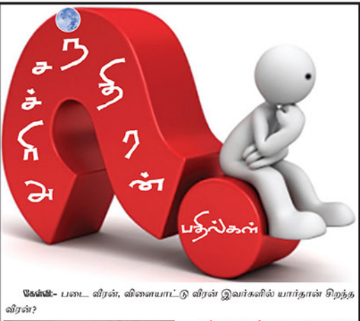
சென்னை - படை வீரன், விளையாட்டு வீரன் இவர்களில் யார்தான் சிறந்த வீரன்?