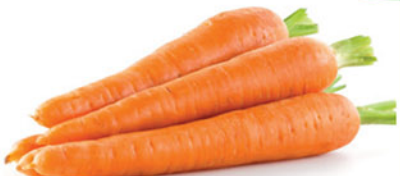
தொடர்ச்சி 22 ம் பக்கம்