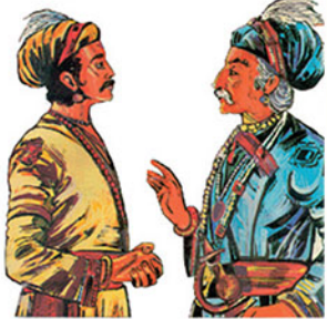
தொடர்ச்சி 22 ம் பக்கம்

பிப்பால் கேட்பதில் ஓர் உள்ளத்தம் இருப்பதை உணர்ந்து கொண்ட அக்பர், உடனே விருந்து பற்றி பொதுமக்களிடம் தெரிவிக்கும்படி உத்தரவிட்டார். தன்மேலான போட்டியே அனைத்து விதிகளுக்கும் சென்ற அரசவை அறிவிப்பாளர், நமது பேரரசர் அனைவருக்கும் விருந்து வைக்கிறார். விருந்துக்கு வருவோர் கண்டிப்பாக ஒரு குடத்தில் பால் கொண்டு வர வேண்டும். இது அரசு உத்தரவு, என்று உத்தரவு குரவில் அறிவித்தார்.