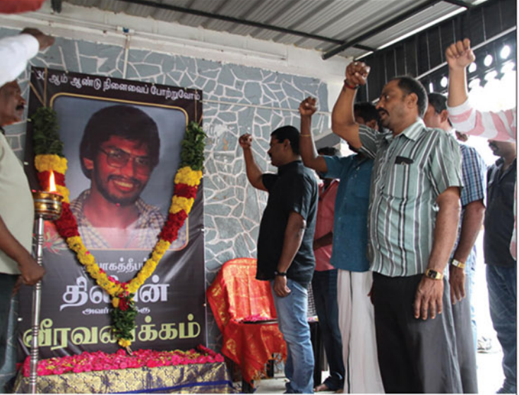
தியாக தீபம் திலீபனின் 30ம் ஆண்டு நினைவுநாளை யொட்டி கடந்த 26ம் திகதி சென்னை வளசரவாக்கத்தில் உள்ள நாம் தமிழர் கட்சியின் தலைமை அலுவலகத்தில் நினைவேந்தல் நிகழ்வு நடைபெற்றது. இந்நிகழ்வில் தியாகதீபம் திலீபன் அவர்களின் உருவப்படத்திற்கு நாம் தமிழர் கட்சியின் தலைமை ஒருங்கிணைப்பாளர் சீமான் அவர்கள் சுடரேற்றி மலர்வணக்கம் மற்றும் வீரவணக்கம் செலுத்தினார்.

அயர்லாந்து மக்களின் விடுதலைக்காக மகத்தான உண்ணாவிரதப் போராட்டம் நடந்திய தியாகி பாபி சாண்ட்ஸ், 1981 மே 5 ஆம் தேதியன்று உயிர் நீத்தார். உலகெங்கிலும் உள்ள மனித உரிமைக் காவலர்கள் அவருக்கு அஞ்சலி செலுத்தினர். எங்கள் மாண்புமிகு திலீபன், ஒரு சொட்டுத் தண்ணீர்க்கு அருந்தவில்லை. இரண்டாயிரம் ஆண்டுகளுக்கு முன்னர் தமிழ் மன்னன் கணணக்கால் இரும்பொறை, சிறைச்சாலையில் அவமதிக்கப்பட்டதற்காக தண்ணீர் பருகாமலேயே உயிர் நீத்ததைப் போல, திலீபனும் தன் ஆவியைத் தந்தார். மனித உரிமைகள் மீறலின் விளைவுதான் திலீபனின் சோக மரணம் ஆகும் என்று குறிப்பிட்டார்.