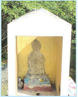
பட்டு மீண்டும் குறித்த இடத்தில் வைக்கப்பட்டிருந்தது. இந்த நிலையில் கமார் ஒரு மாத காலத்தில் மீண்டும் குறித்த பின்னையார் சிலை மீண்டும் உடைத்துச் சேதப்படுத்தப்பட்டுள்ளது.

உதாரணமாக திருகோணமலை மாவட்டம் கிண்ணியா பிரதேச செயலாளர் பிரிவினாள் மட்டக்களப்பு திருமலை பிரதான வீதியில் உள்ள உப்பாறு கிராமத்தில் 60க்கும் மேற்பட்ட தமிழ் குடும்பங்கள் வாழ்ந்தனர். எனினும் அவர்கள் யுத்தம் காரணமாக இடம்பெயர்ந்திருந்தனர். தற்போது மீள்குடியேற்ற மக்கள் தயாராகவுள்ள நிலையில், அவர்களின் சொந்தக் காணி எவ்வளவு இருந்தாலும் 10 பேர் மாதிரி வழங்க அரசாங்கம் நடவடிக்கை எடுக்கிறது.