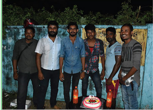
தமிழீழத் தேசியத் தலைவரின் 63வது அகவையை உலகத் தமிழர்கள் கொண்டாடிய அதேவேளையில், தமிழீழம் வல்வெட்டித்தூறையில் உள்ள அவரது வீட்டிற்கு முன்பாக இளைஞர்கள் சில கேக் வெட்டி அவரது பிறந்தநாளைக் கொண்டாடியுள்ளார்கள்.

இதேவேளை நாம் தமிழ் கட்சியின் ஒருங்கிணைப்பாளர் சீமான் கேக் வெட்டி எழுச்சி விழாவை நடத்தினார்.