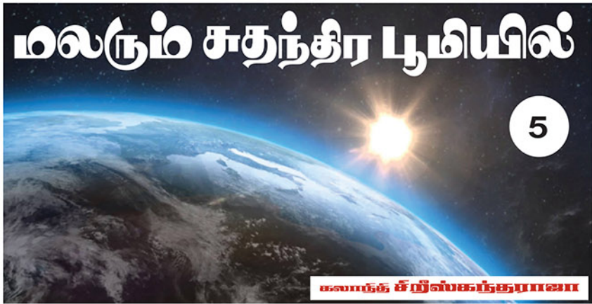
கலாநிதி சிறீலங்கா அகாடமி

சுலைமானி பல்கலைக்கழகம் பற்றிய அறிமுகம் நிறைவடைந்ததும், மறுநாள் நடைபெறவிருந்த மாநாட்டிற்கு முன்னோடியான எமது உள்ளக ஆலோசனைக் கூட்டம் தொடங்கியது. ஒருபுறம் குர்ஜிஸ்தான் சுதந்திரப் போராட்டம் பற்றியும், தற்பொழுது சுயாட்சி அதிகாரத்தைக் கொண்டுள்ள குர்ஜிஸ்தான் மாநிலம் தனிநாடாக அங்கீகரிக்கப்பட்டால் எவ்வாறான சவால் களுக்கு அது முகம்கொடுக்க நேரிடும் என்பது தொடர்பாகவும் அங்கு வந்திருந்த குர்ஜி அரசுநிவியலாளர்கள் விளக்கமளித்தார்கள். மறுபுறத்தில் கான்மீர், தென் சூடான், பலஸ்தீன் ஆகிய தேசங்களின் சுதந்திரப் போராட்டங்கள் பற்றி அங்கு வந்திருந்த பன்னாட்டு அரசுநிவியலாளர்கள் விளக்கமளித்தார்கள். இப்பொழுது தமிழீழம் பற்றிப் பேசும் முறை வந்தது. வழமையாக தமிழீழ விடுதலைப் போராட்டம் பற்றி மேற்குலக நாடுகளின் பல்கலைக் கழகங்களில் நாங்கள் பேசுவதென்றால், வெகு எச்சரிக்கையாகவே பேசுவோம். ஒவ்வொரு வார்த்தைகளையும் இரு