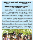
சிங்களத்தின் கைப்பொம்மைகளாக இருக்கின்றன. ஆனால், இறுதி வந்ததும் தொடர்

தமிழ் அம்பலப்படுத்துவதற்கும் தமிழ்த் தலைமைப் புலிகள் தமிழ்த் தேசியக் கூட்டமைப்பிற்கு அங்கீகாரம் வழங்கினர். தமிழ்த் தலைமைப் புலிகளின் கட்டமைப்புகள் இருக்கும் வரை இரா.சம்பந்தத் தலைமையிலான தமிழ்த் தேசியக் கூட்டமைப்பு அப்பணிவை முன்னெடுத்து வந்தது. ஆனால், இறுதி வந்ததும் தொடர்